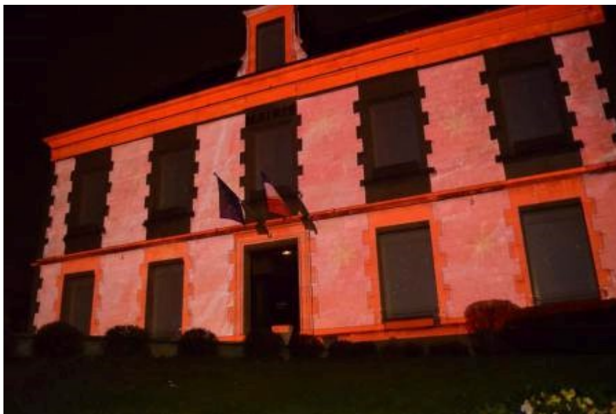
Mapping vidéo mairie de Carpiquet (14), décembre 2014

Bandit Visions est un collectif de création audiovisuelle fondé en 2011. Basé à Caen (Basse-Normandie), les intervenants proposent différentes installations où la conception vidéo tient une place majeure, mêlant recherche plastique, réflexion artistique et innovations techniques. Ces installations vont de la scénographie théâtrale, au mapping, en passant par le vjing et le live musical.